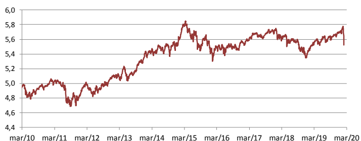
Gráfico de performance – Evolução da UP (€)

Adicionalmente, foi vendida a posição no fundo LFIS Vision Primia, foi reduzida a exposição ao crédito e reforçou-se a posição a governos europeus.