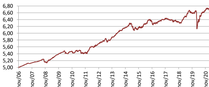
Gráfico de performance – Evolução da UP (€)

A rentabilidade do seguro foi negativa em -0.85%. O Seguro terminou o mês com uma Yield to Maturity de 0.66% e uma duração 5.42 anos.