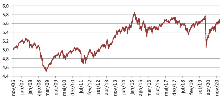
Gráfico de performance – Evolução da UP (€)

No mês de Fevereiro, manteve-se o nível de risco em ações, com preferência pelas ações americanas face às europeias, investindo-se na bolsa japonesa. Em relação a rendimento fixo, manteve-se a preferência por exposição a dívida de governos periféricos versus países core . Em Crédito, manteve-se a aposta em posições de emissores Investment Grade, High Yield e países emergentes.