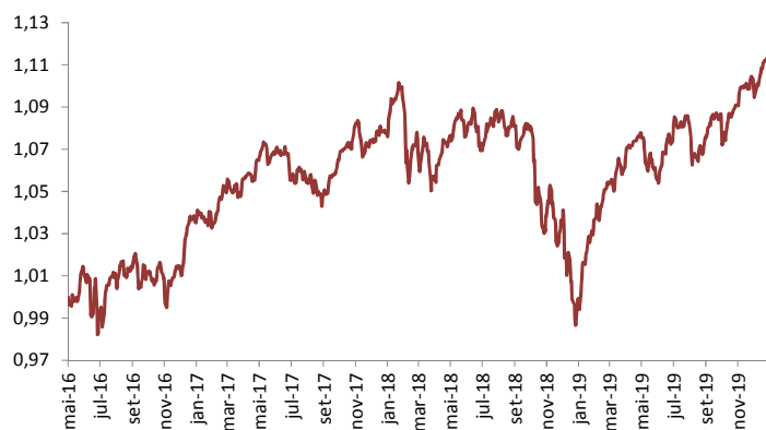
Gráfico de performance – Evolução da UP (€)